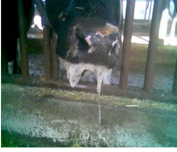
İlk etapda aşırı sicim tarzında salya görünümü( Şentürk S)