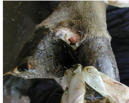
Vezikülerin yırtılması ile erozyonların oluşumu ( Şentürk S)