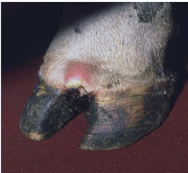
Su kesecikleri benzeri - vezikül oluşumları (Şentürk S)